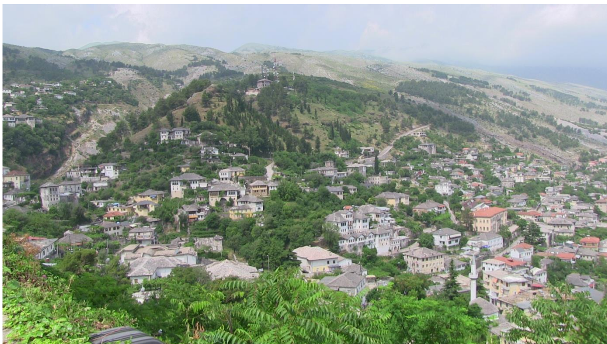
Panorama okolic Sarandy – miasteczko Gjirokastra