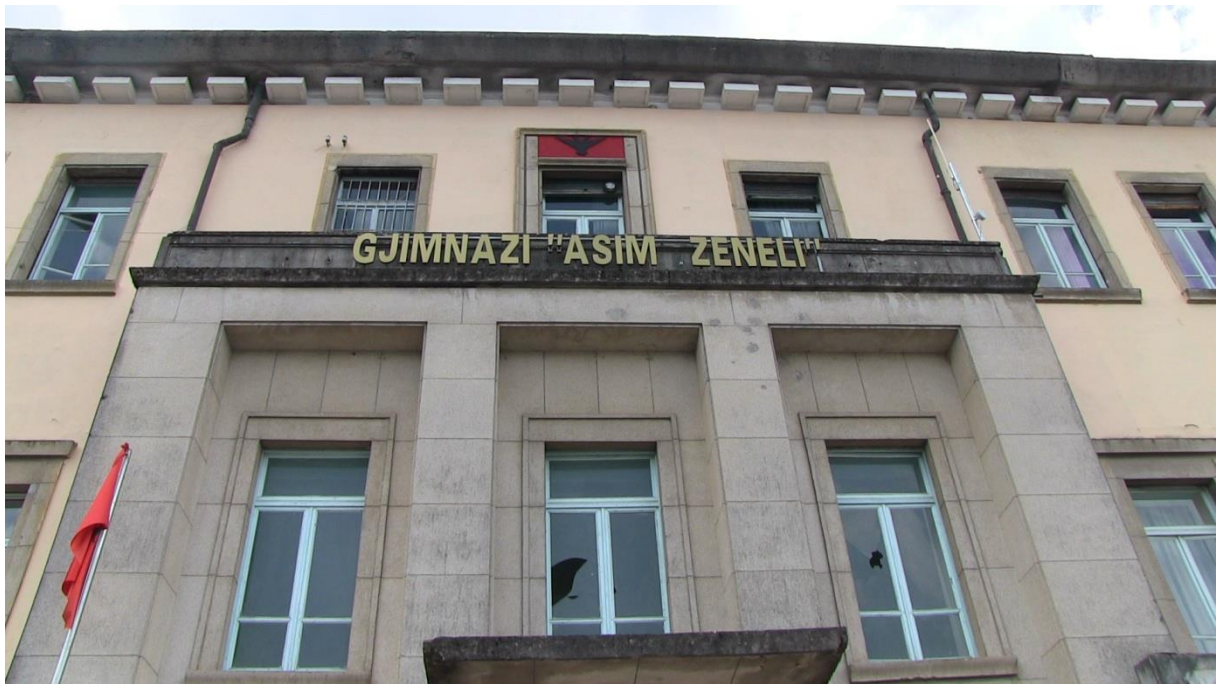
Gimnazjum w okolicy Sarandy