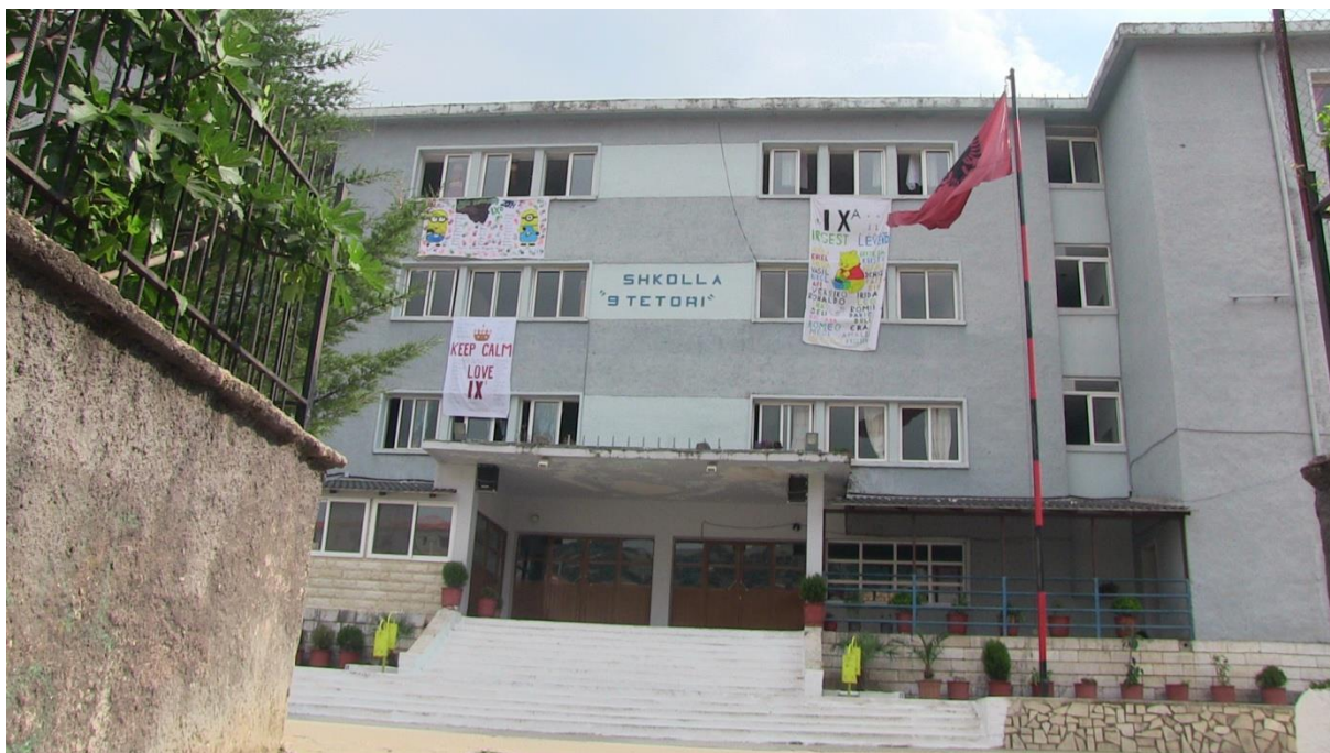
Szkoła podstawowa w Sarandzie